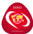
International Sport Network Organization

jest członkiem zwyczajnym organizacji międzynarodowych